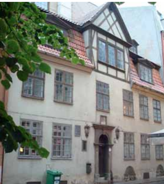
▼ Дом № 45 по улице Калею