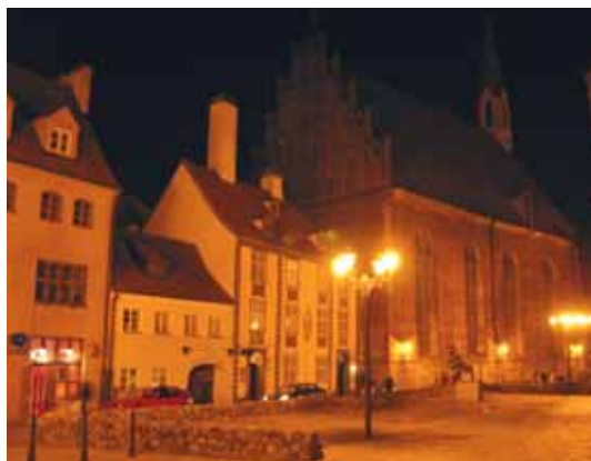
▼ «Конвента сета» и церковь Святого Георгия

Стефана Батория. Хроники утверждают, что он распределял городские подряды среди своих друзей и родственников. Чтобы снять негативное мнение о себе, он организовал