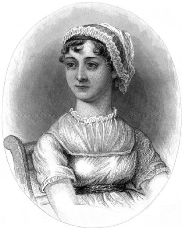
Предполагаемый портрет Джейн Остен