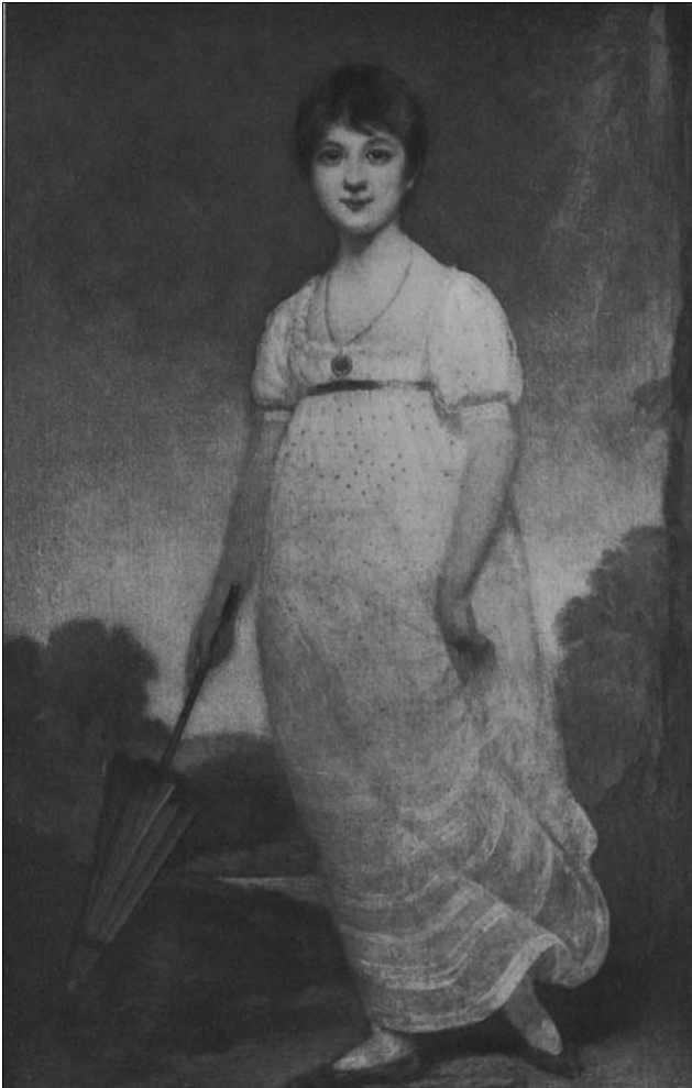
Предполагаемый портрет Джейн Остен кисти Озайаса Хамфри

До нас дошло два прижизненных портрета Джейн Остен. Один — акварельный набросок ее сестры Кассандры, ко-