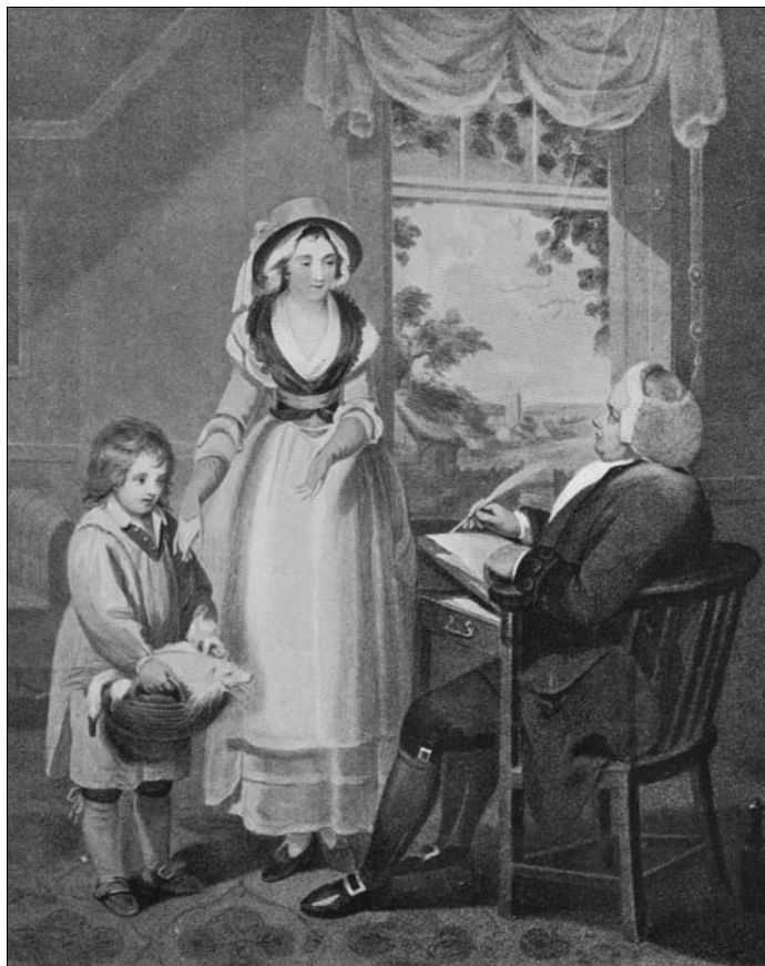
Священник получает десятину

сятину. Чтобы не разрываться между ними, ректор назначал vikaria, т. е. своего заместителя, который постоянно проживал в приходе и получал только часть десятины. Наконец, у священника мог быть помощник (curate), обычно молодой священник, проходивший стажировку в приходе. Помощник помогал ректору или vikariu вести приходские дела и заменял его на службе, если тому требовалось отлучиться. За свои труды помощник получал довольно скромное жалованье.