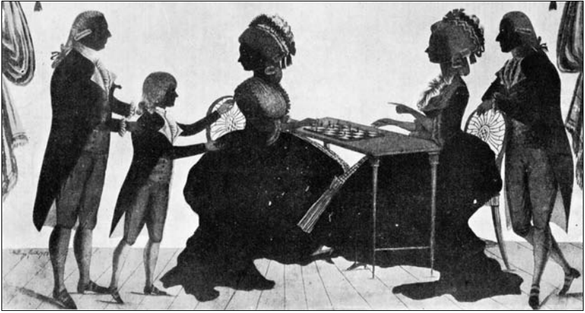
Мистер Остен представляет сына Эдварда мистеру и миссис Найт

ства. Поэтому Остены не удивились просьбе Найтов, ведь они тоже брали к себе племянников.