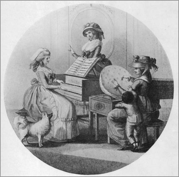
Женские занятия. Гравюра XVIII века

на выданье. Кроме того, в доме имелась огромная библиотека — более 500 томов, по тем временам, да еще и для провинции, просто невероятное количество книг! Книжные полки никогда не запирались от дочерей. Джейн с детства могла читать что угодно, от «Истории Англии» Голдсмита до произведений Филдинга, Ричардсона и Стерна, а также популярной романистки Фанни Берни.