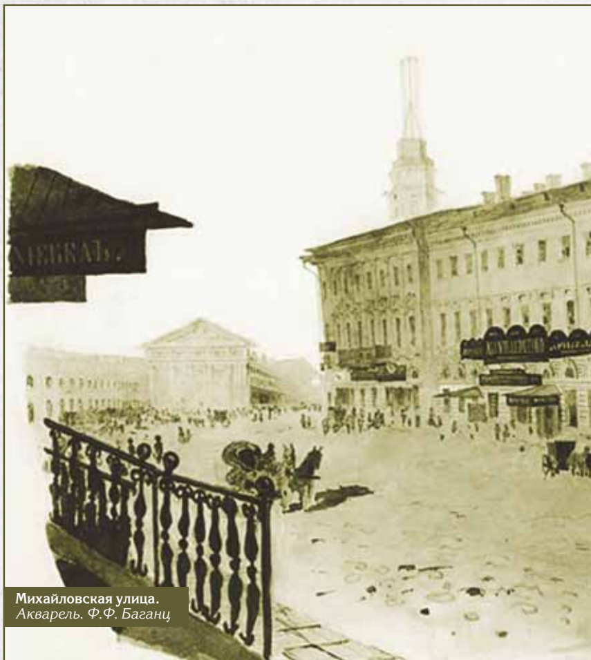
Михайловская улица. Акварель. Ф.Ф. Баганц